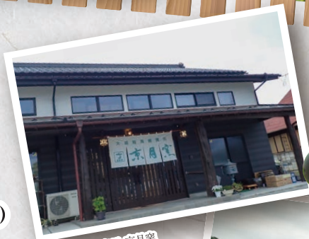
大堀相馬焼窯元 京月窯