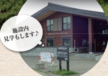
浄土平ビジターセンター