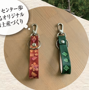
ワークセンター歩によるオリジナルのお土産づくり