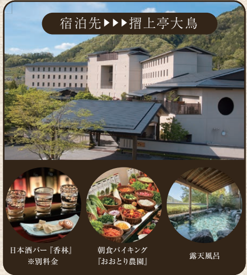
日本バー「香林」 ※別料金