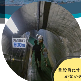
■摺上川ダム (茂庭つ湖)